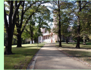
Blick zum Schloss

Auch ein visueller Rundgang durch den Schlosspark Biesdorf ist möglich. Danach dann einen entspannten Spaziergang im Schlosspark.