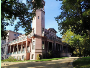
Süd - Ost - Ecke

Erleben Sie einen visuellen Rundgang um das Schloss Biesdorf / außen. Lassen Sie sich zu einen Spaziergang vor Ort anregen.