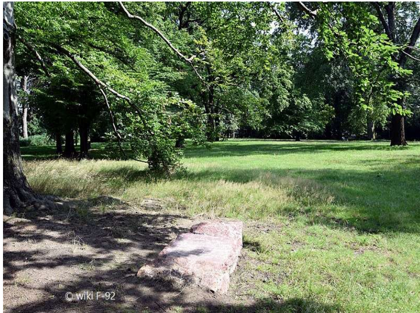
Soldatenfriedhof / Notfriedhof - Gedenkstein

www.guide-anders.de > Schlosspark > Fotogalerie > Soldatenfriedhof