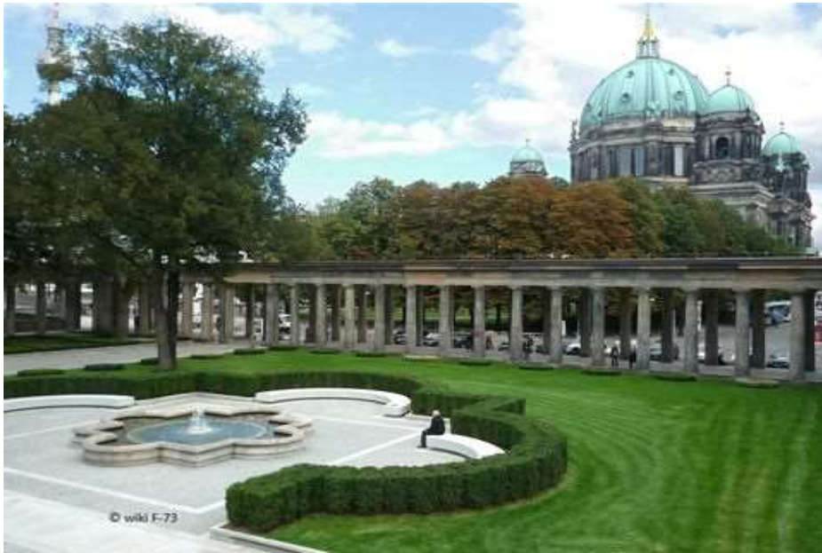
Parkanlage - Kolonnadenhof - Museumsinsel

www.guide-anders.de > Schlosspark > Fotogalerie > E.Neide