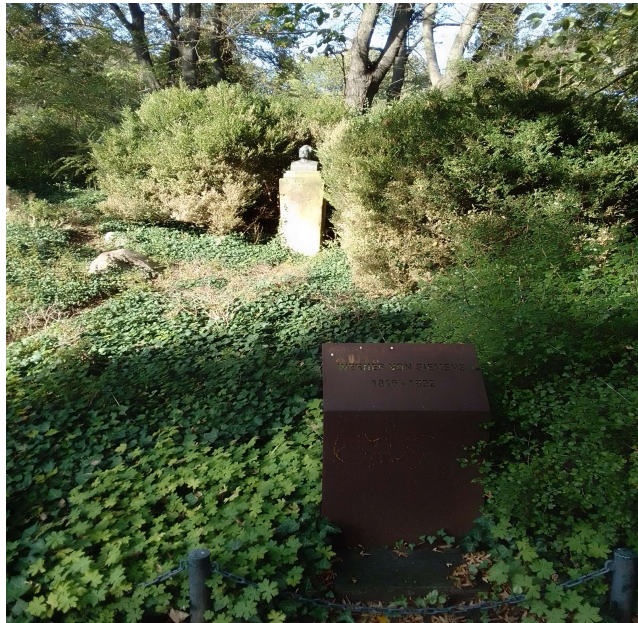
Siemensbüste - Auf der Rückseite vom Eiskeller

www.guide-anders.de > Schlosspark > Fotogalerie > Siemensbüste