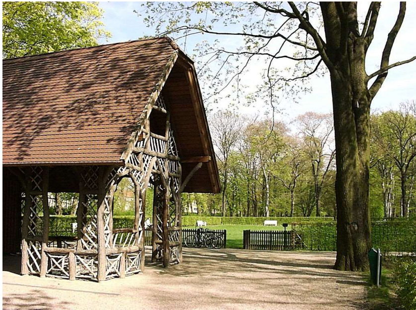
Teepavillon mit Blick zum Lesegarten Foto wiki F-79

www.guide-anders.de > Schlosspark > Fotogalerie > Teepavillon