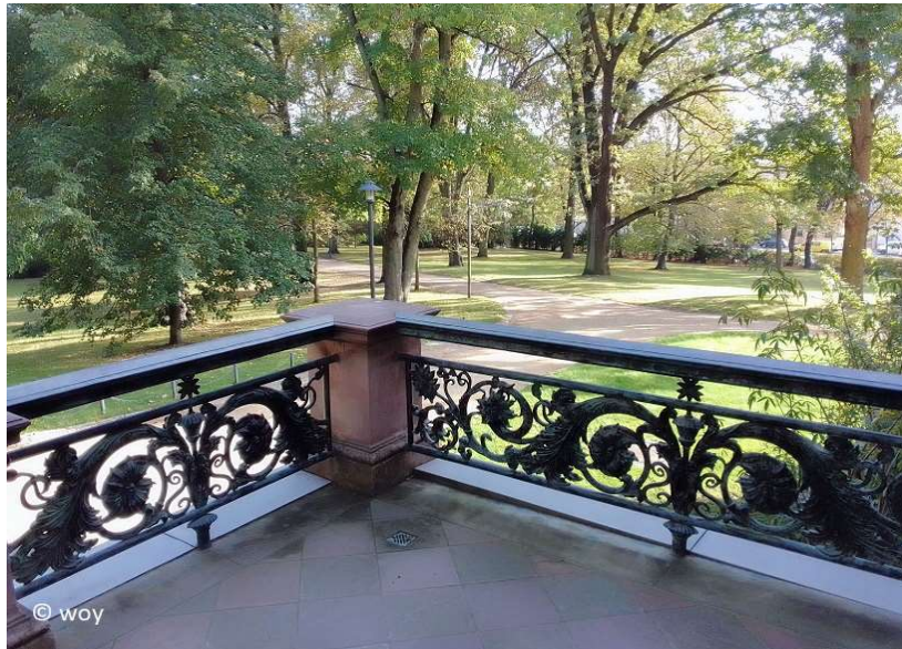
Blick vom Schloss zum Park

www.guide-anders.de > Schlosspark > Fotogalerie > Parkgestaltung Überbl.