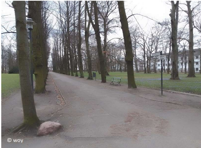
Brodersen Allee von der Nordseite zum Schloss

www.guide-anders.de > Schlosspark > Fotogalerie > Brodersen Allee