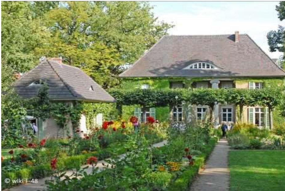
Liebermann - Villa - Stand 2011