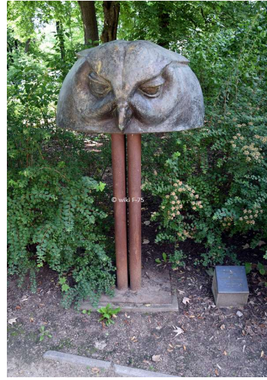
Der Eulenkopf - von M. Klein

www.guide-anders.de > Schlosspark > Fotogalerie > Skulpturen