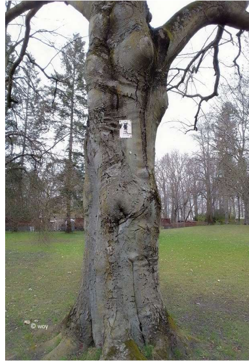
Baum - Naturdenkmal im Park

www.guide-anders.de > Schlosspark > Fotogalerie > Natur