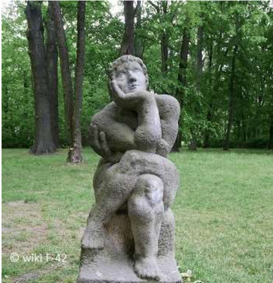
Die Sinnende - von I. Hunzinger