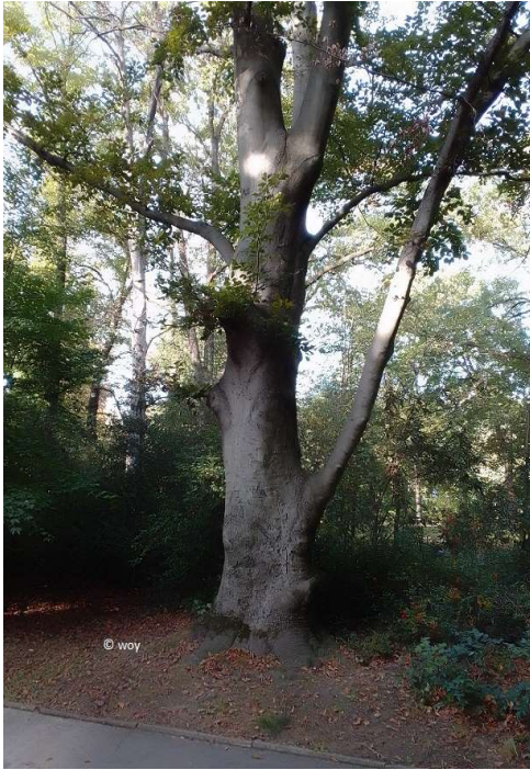
Baum am Nordeingang