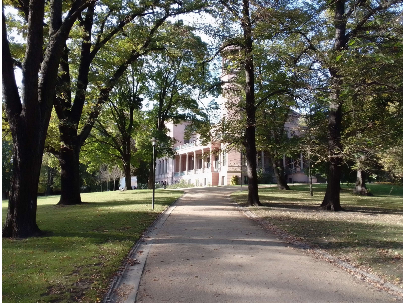
Blick vom Park zum Schloss