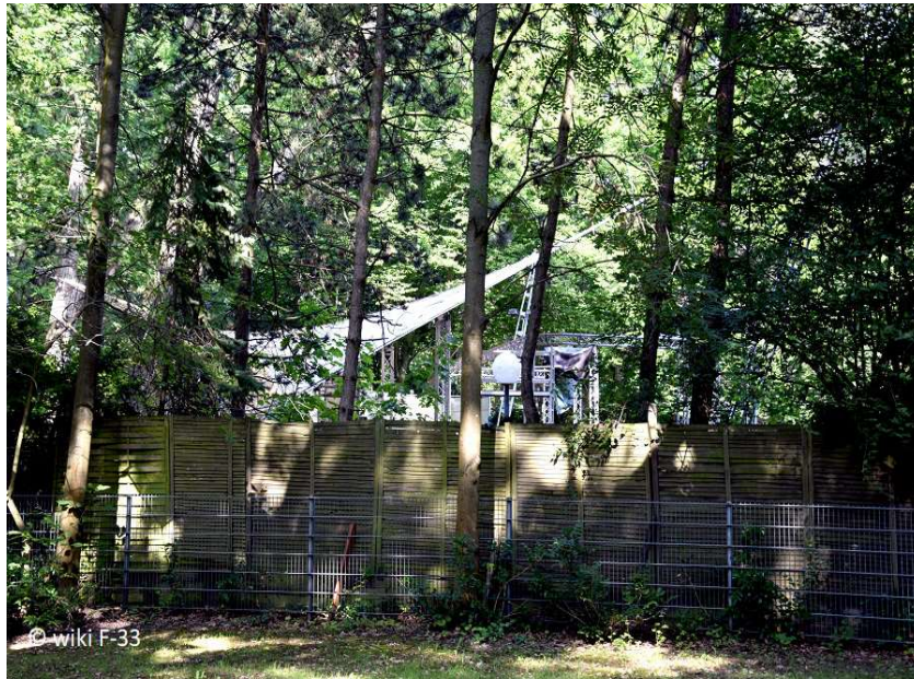
Parkbühne Biesdorf - Blick über den Zaun auf die Bühne

www.guide-anders.de > Schlosspark > Fotogalerie > Parkbühne