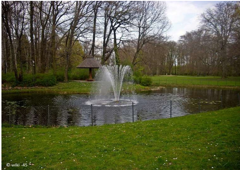
Schlossteich mit Fontäne und Parasol im Hintergrund

www.guide-anders.de > Schlosspark > Fotogalerie > Schlossteich